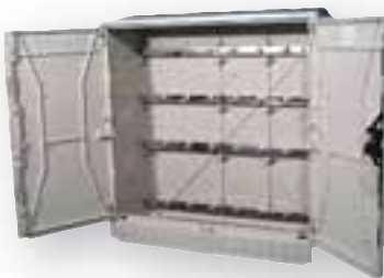
Káblové rozvodné skrine s Cu zbernicami