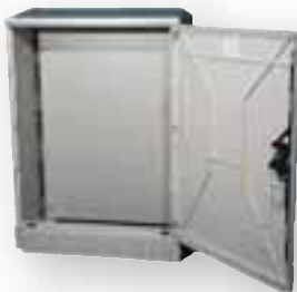
Káblové rozvodné skrine-prázdne